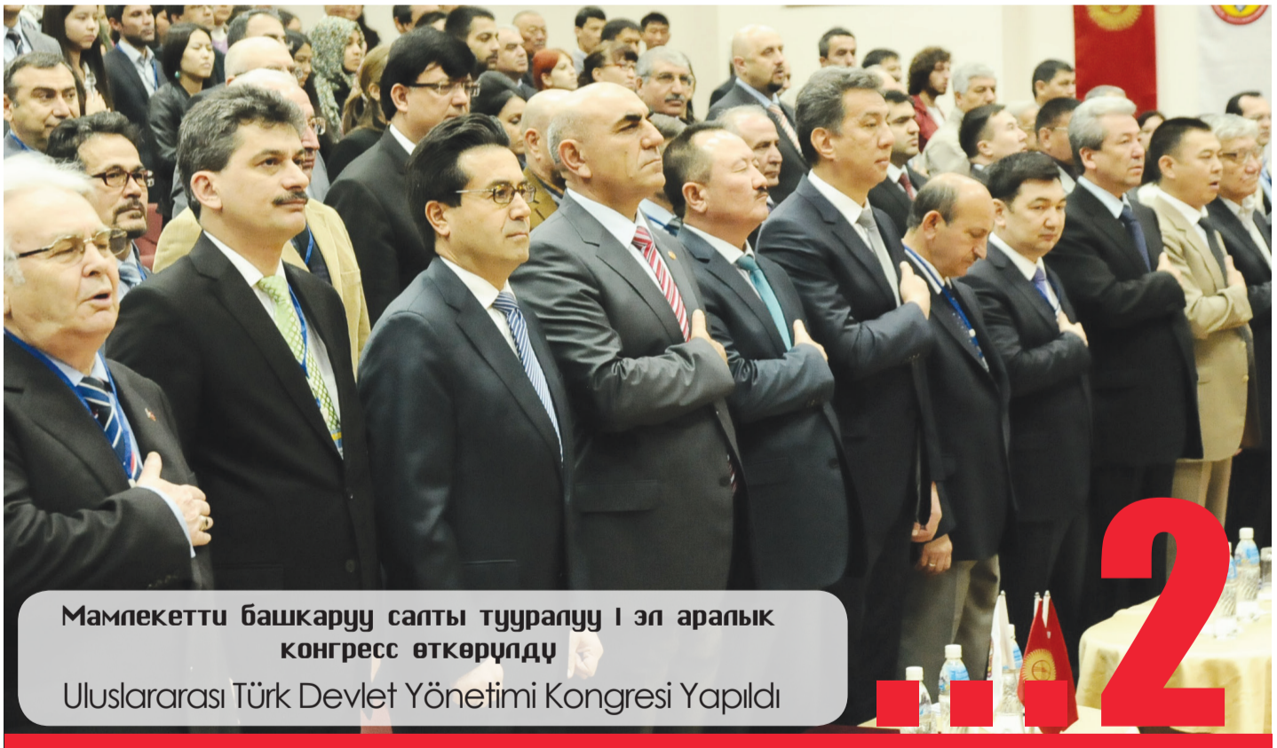
Мамлекетти башкаруу салты тууралуу I эл аралык конгресс өткөрүлдү Uluslararası Türk Devlet Yönetimi Kongresi Yapıldı

Унутта калган кыргыз бийи "Кара жорго" Unutulan Kırgız Dansı Kara Corgo 13