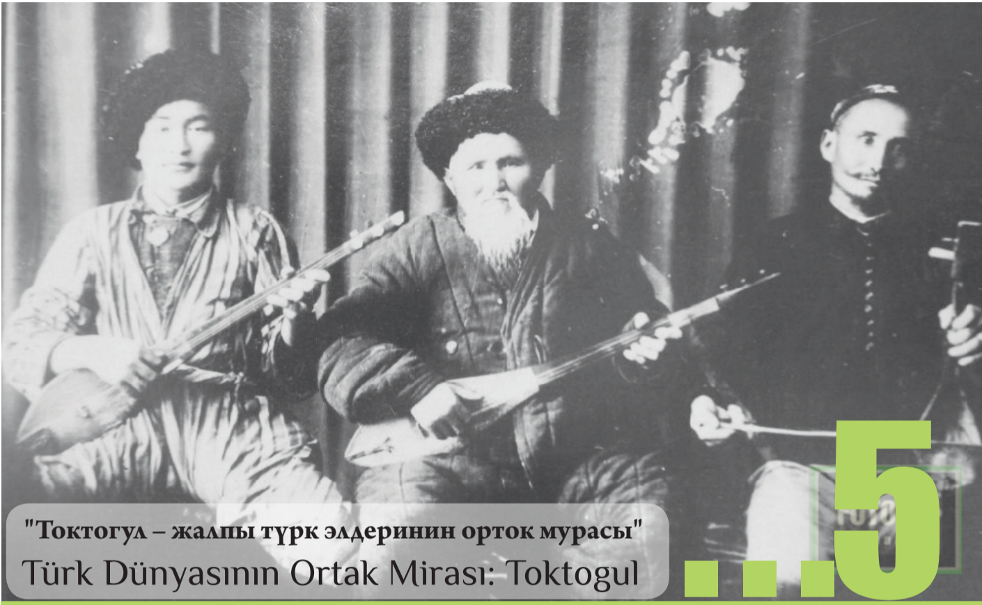
"Токтогул – жалпы түрк элдеринин орток мурасы" Türk Dünyasının Ortak Mirası: Toktogul